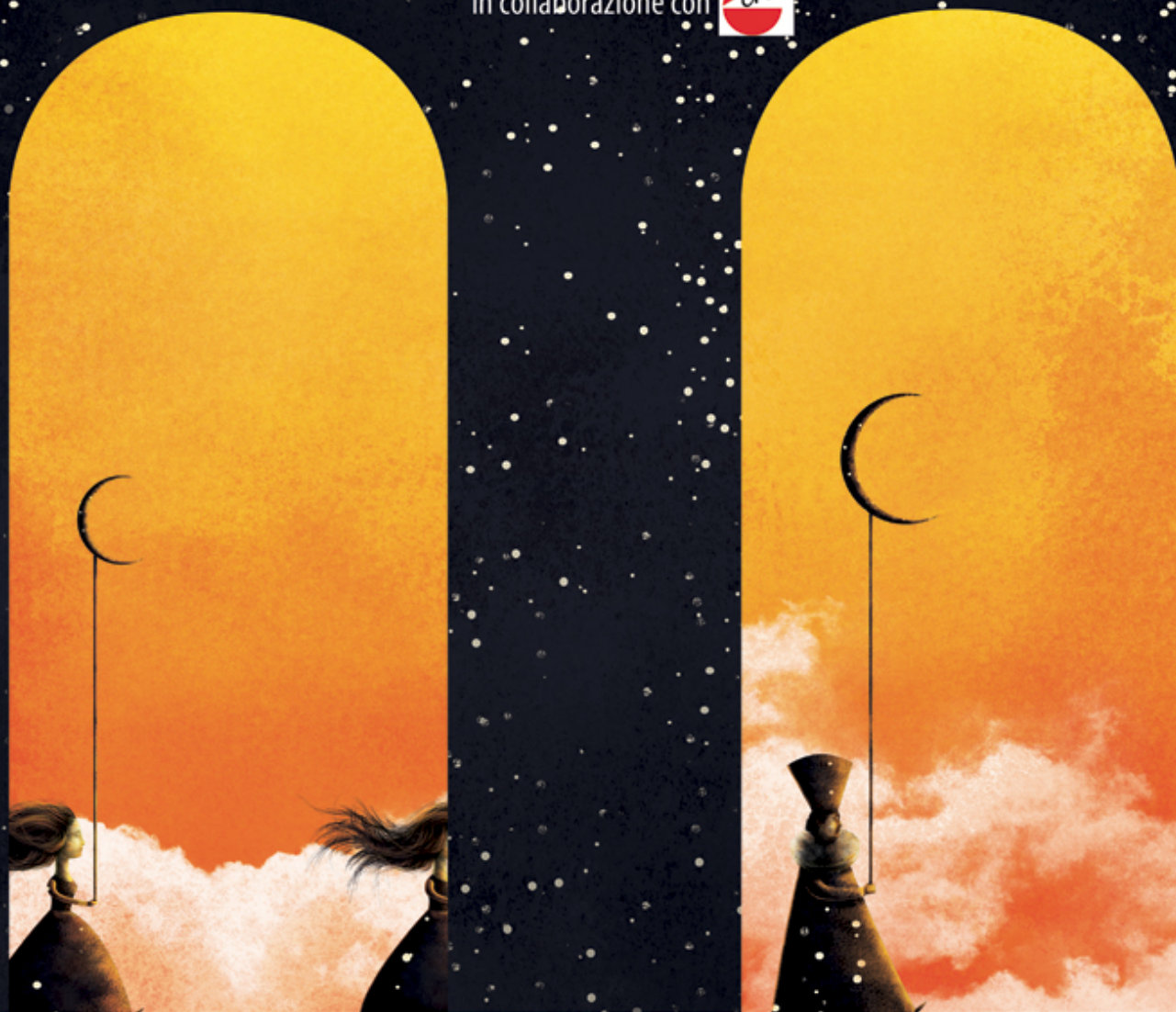
ILLUSTRAZIONE ED ELABORAZIONE GRAFICA DI FRANCESCA COSANTI

Laboratorio per ragazzi dai 16 ai 30 anni Da febbraio a giugno 2015