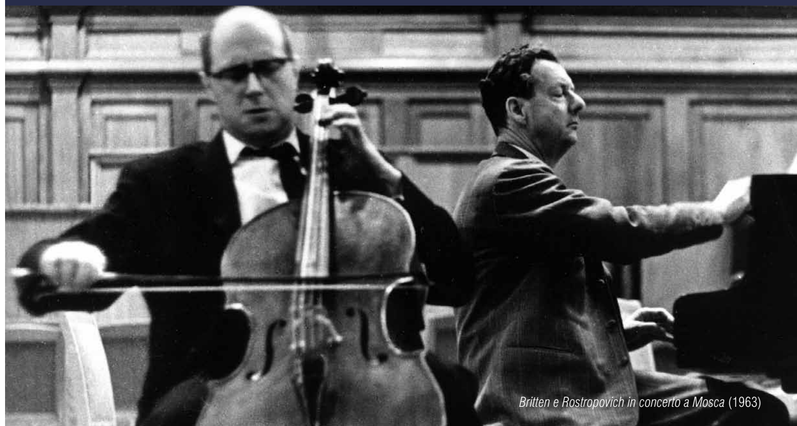
Britten e Rostropovich in concerto a Mosca (1963)

Degustazione di pettole e vino BRITdj-set a cura de La Carrozza di Hans